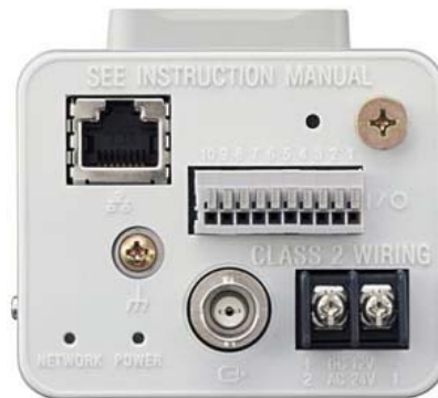
Widok ścianki tylnej

Kamera IP SONY SNC CS3 posiada funkcję obsługi standardu kompresji M-JPEG, generuje obrazy z maksymalną rozdzielczością 736x544 pikseli.